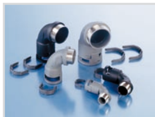
IP66/IP68 - 90°

PMA offers a broad product portfolio of cable protection products for high and low frequency technology applications and also for fibre optic cables. Our 30 years experience in the design and production of cable protection systems guarantees optimal solutions for use in power generation applications whether they are driven by water, wind, sunlight or gas.